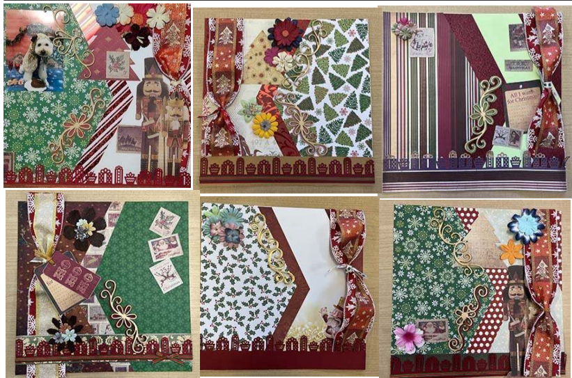
クラブブックイング クリスマス12インチ 12/16