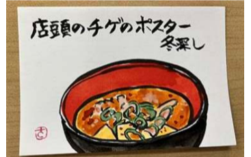
1月8日パステルアート